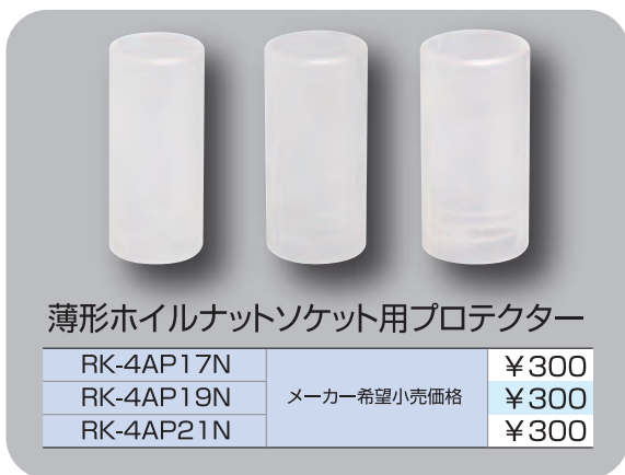
薄形ホイールナットソケット用プロテクター