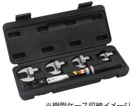
※樹脂ケース収納イメージ