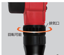
排気の向き変更可能