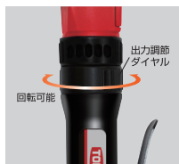
出力調整ダイヤル