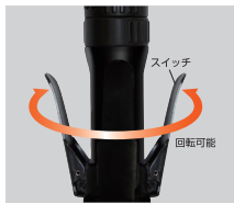
スイッチの向き変更可能