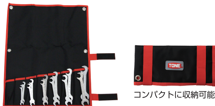
コンパクトに収納可能