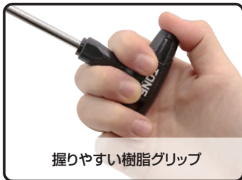
握りやすい樹脂グリップ