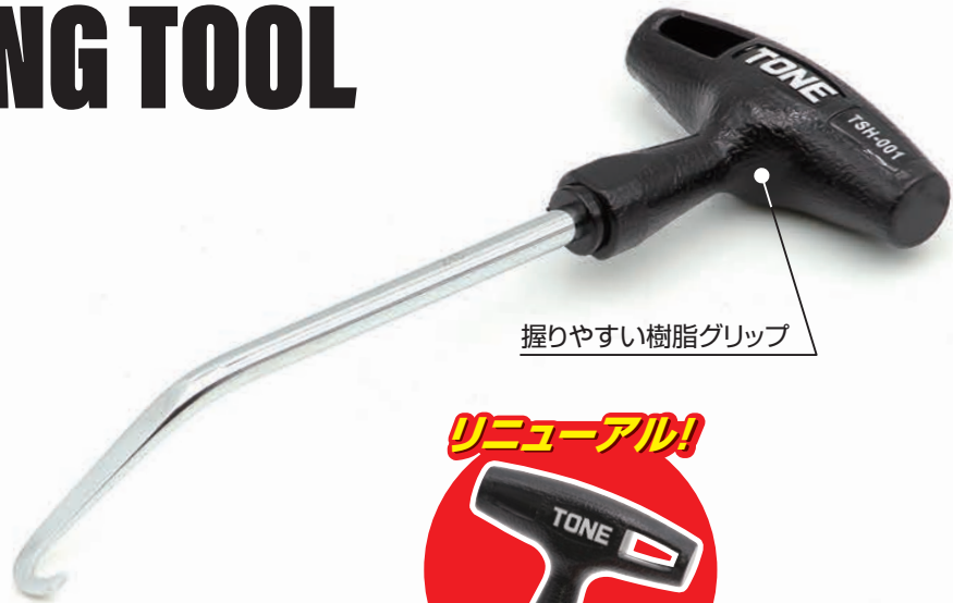
握りやすい樹脂グリップ

ドラムブレーキやオートバイのマフラーなどに使用されるスプリング着脱専用のテンションスプリングフックが握りやすい樹脂グリップになって新登場!