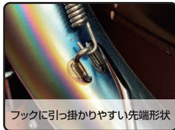
フックに引っ掛かりやすい先端形状