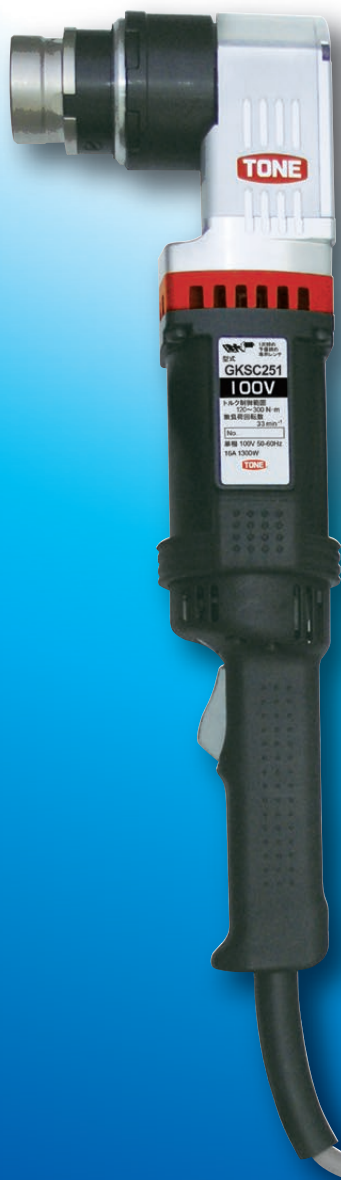
トルシアボルト用 GKSC251/GKSC252

トルシア型高力ボルト・高力六角ボルトの 1次締め作業を効率的に行うために最適な電動レンチ