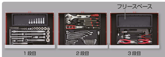
■ トレーでの引出し収納例