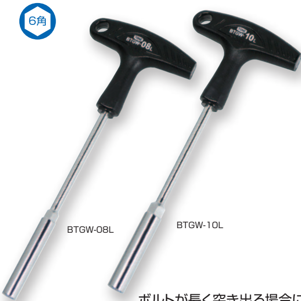
ボルトが長く突き出る場合に 役立つディープタイプ