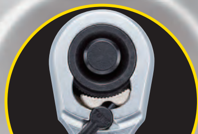
クサビ式 ギアとカムの歯が 8段噛合う新機構