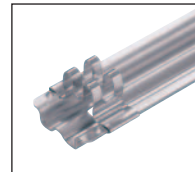
ソケットホルダー