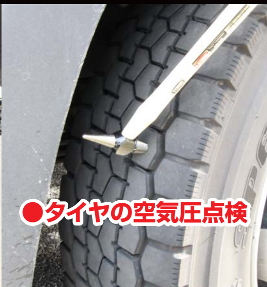
●タイヤの空気圧点検