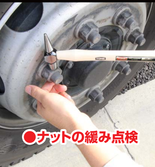
●ナットの緩み点検