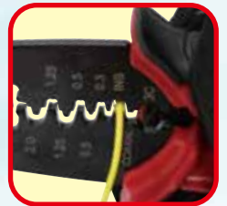
インスレーションバレル(INS)の圧着