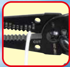
ワイヤーストリップ