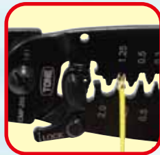
オープンバレルの圧着