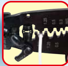
クローズドバレルの圧着