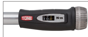
デジタル表示部分 (特許・意匠取得済)