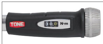
デジタル表示部分(特許・意匠取得済)