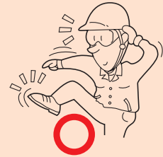
図 3 fig.3

Do not disassemble or modify wrenches except expendables. Disassemble or modification made by unauthorized personnel may result in malfunction or personal injury. (fig.2)