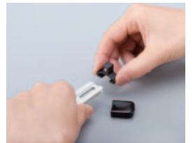
※ソケットホルダー(アルミタイプ)用クリップを追加することができます。